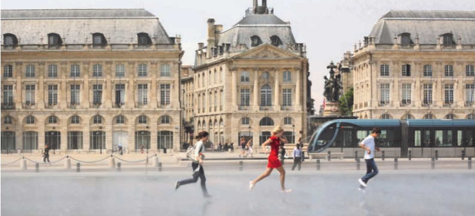
Praça "Place de la Bourse"