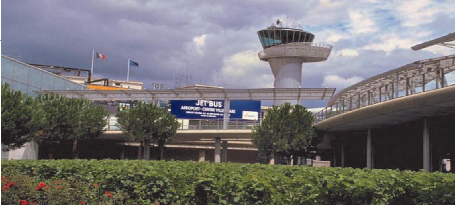
Aeroporto Internacional de Bordeaux