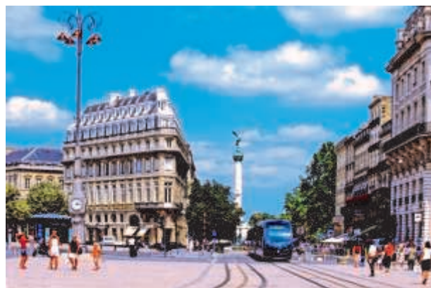
Praça "Place de la Comédie"

Graças ao programa de desenvolvimento urbano em grande escala da cidade, o rio Garonne está novamente integrado à vida da cidade, e não mais constitui uma barreira entre as margens direita e esquerda. De fato, as margens ressuscitaram e tornaram-se o palco de eventos de destaque como Bordeaux Fête le Vin (Festival de vinho de Bordeaux) e Bordeaux Fête le Fleuve (Festival aquático de Bordeaux). Numerosos passeios de barco estão disponíveis no porto Port de la Lune , bem no centro da cidade.